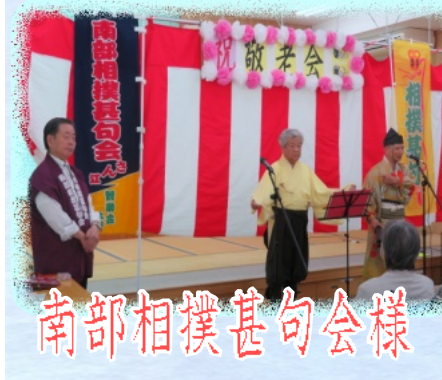
南部相撲甚句会様